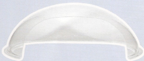
Width 900 mm, Depth 500 mm, Height 300 mm